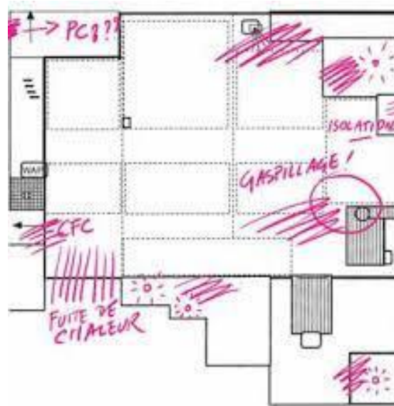
► Cartographie de l'entreprise