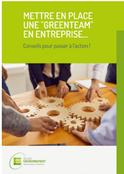
► Brochures informatives