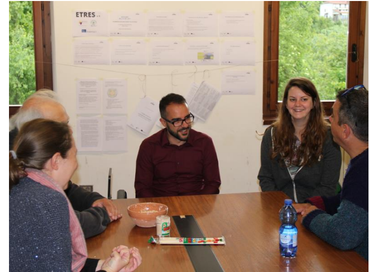
► Accompagnement externe