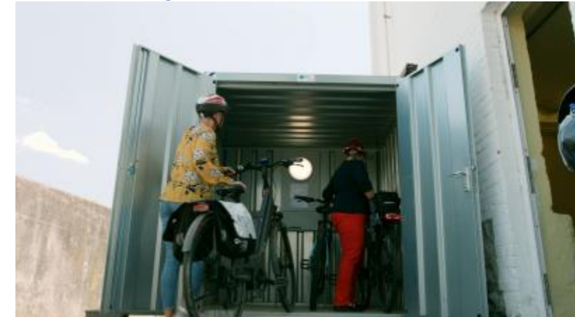
Parking vélo de Vivalia à Marche-en-Famenne