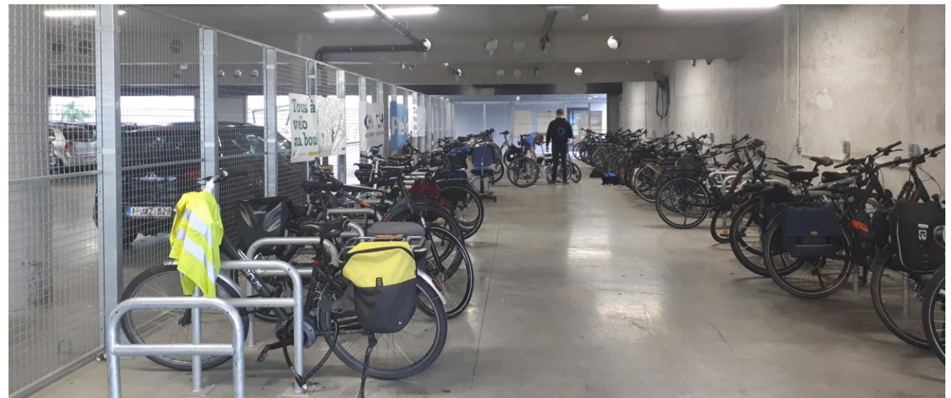
Parking vélo du Groupe Santé CHC Mont-Legia